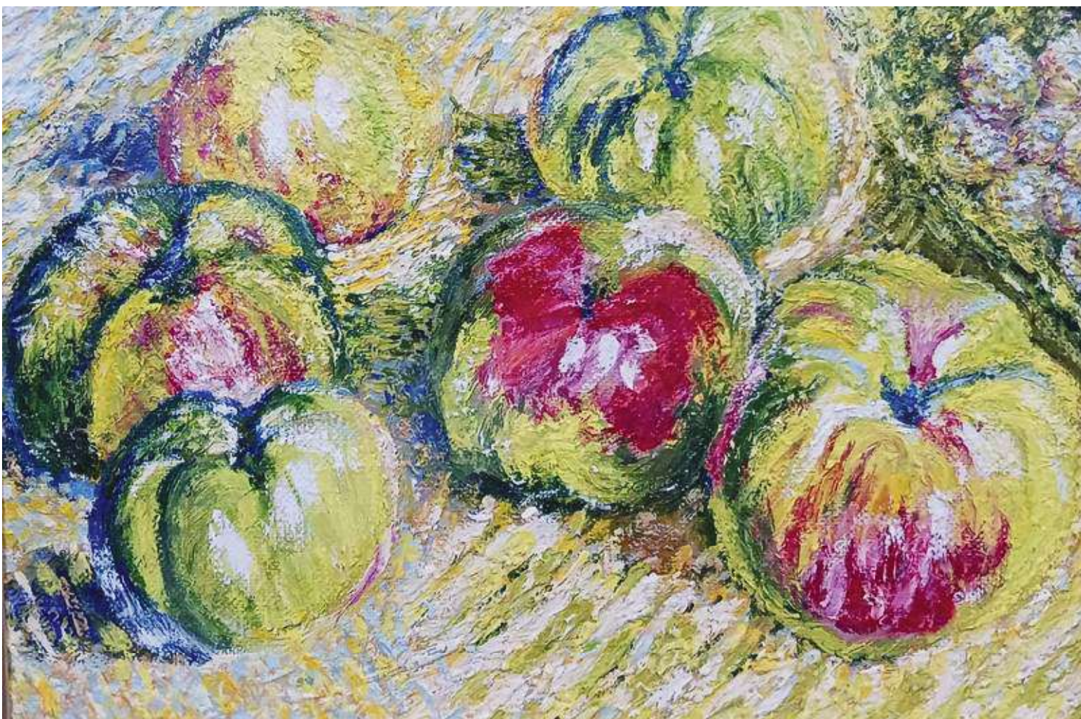
「林檎と葡萄」 油絵 甲府南支部 山本 武浩