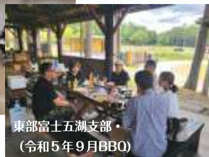
東部富士五湖支部・ (令和5年9月BBO)