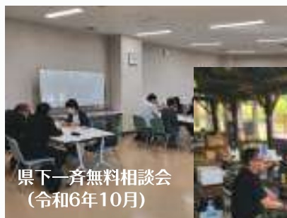
県下一斉無料相談会 (令和6年10月)