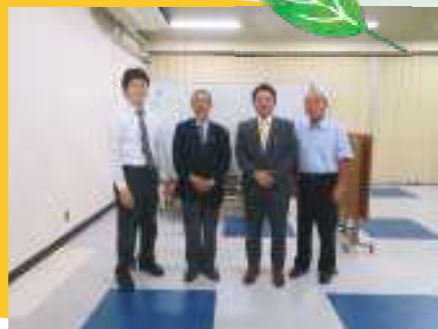
金融機関と合同での無料相談：令和6年度 (東部・富士五湖ブロック)

公益社団法人コスモス成年後見サポートセンターは行政書士による専門職団体であり、定期的な不正防止確認や研修企画を通じて地域に求められる後見人候補の育成を行っています。相談される内容もいわゆる「困難案件」が増えています。市町村の現場も多くの苦勞を抱えており、頼れる専門職の存在に期待が高まっています。行政手続に精通し行政や他士業との連携が得意であることが行政書士の魅力であり、大変なことも多いですが感謝されることが多いです。またコスモスに加入することで、案件に関する悩みの共有やサポートも可能です。高齢化社会において後見制度を利用しなければならない方は多く存在します。私たちも依頼があった場合なるべく近所の行政書士を紹介したいと考えています。